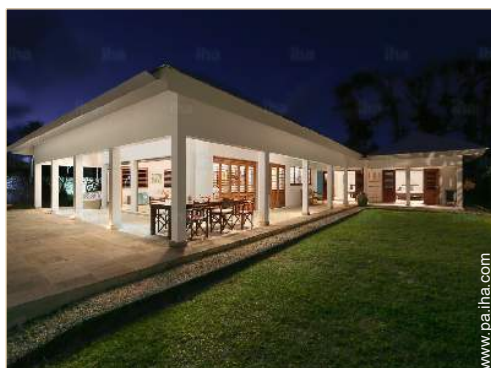
Chalet de Lujo

Acceso directo playa, playa privada, pista helicóptero