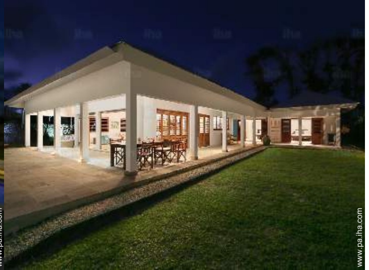
Chalet de Lujo