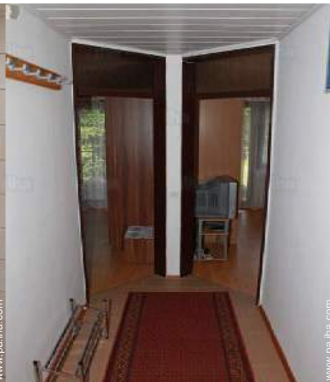
Disposición interior privado