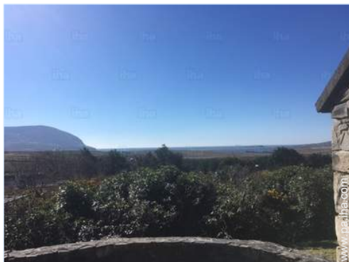
vista desde el patio