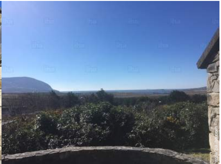
vista desde el patio