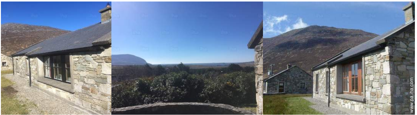
vista desde el patio