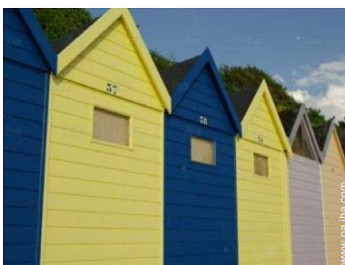
escuela de vela