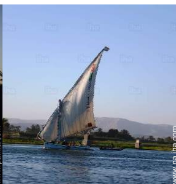
excursión en barco