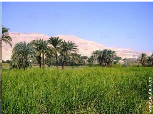
vista sobre la montaña