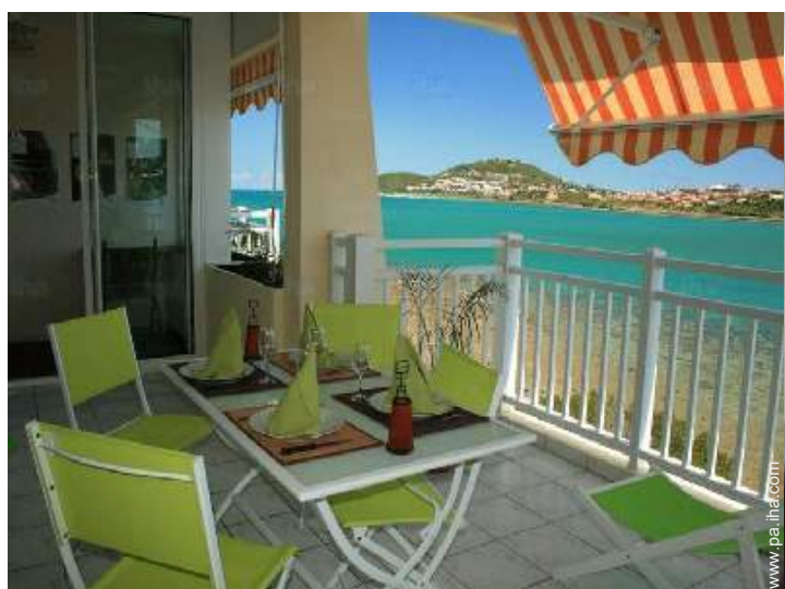
vista desde la terraza cubierta