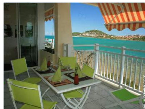
vista desde la terraza cubierta