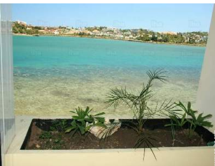
vista desde la terraza cubierta