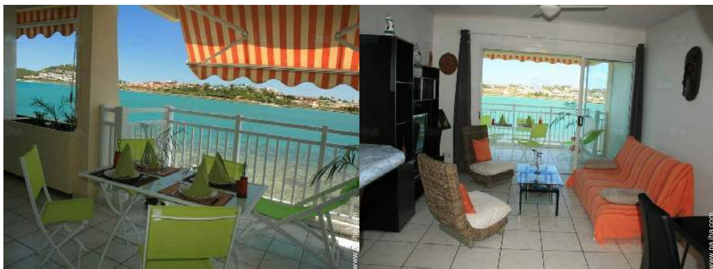
vista desde el salón