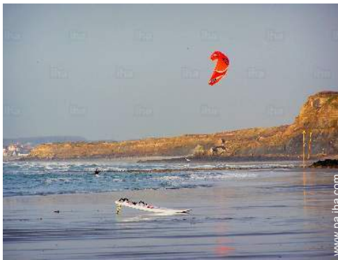
anuncio de windsurf