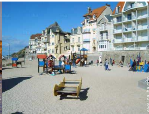
Zonas atractivas y relajación