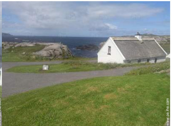
vista sobre el océano