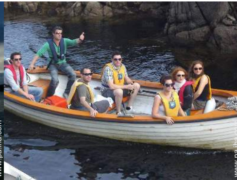
excursión en barco