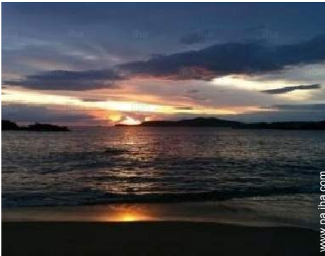
vista sobre la puesta del sol