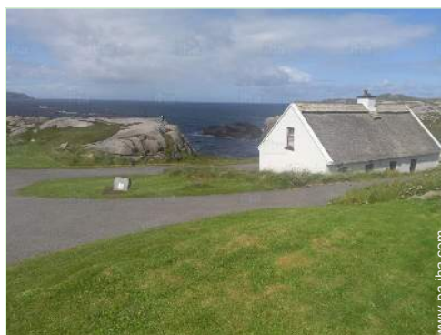
vista sobre el océano

Acondicionado para disminuidos : movilidad