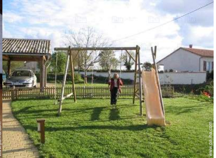
vista desde la cocina