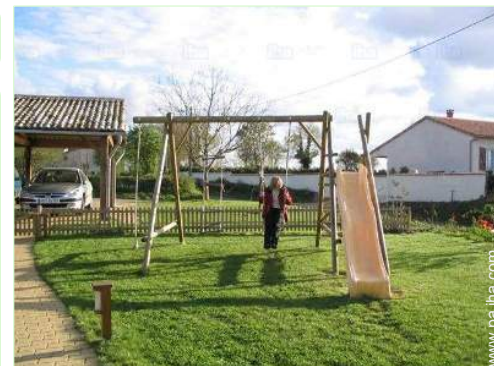
vista desde la cocina