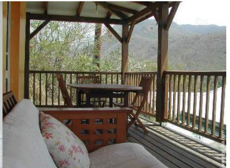
vista sobre la montaña