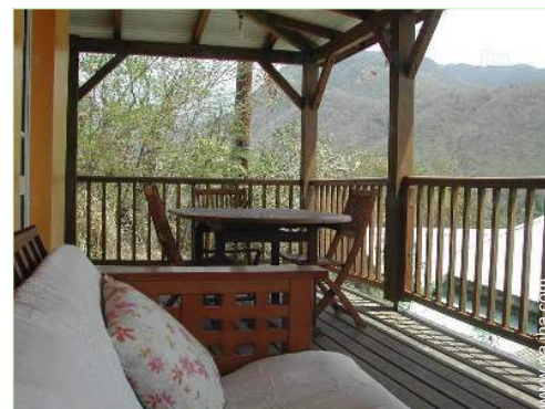
vista sobre la montaña